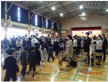
お家の方の拍手の中、元気に入場。

今年度の新一年生は105人。規模が縮小された入学式とはなりましたが、たくさんの保護者の方に見守られる中、最高の笑顔で入学式に臨むことができました。町長様や学校長の問いかけにも大きな声で「ハイ」と返事を返すことのできるスーパー1年生です。保護者の皆様には、様々な面でご心配をおかけしましたが、ご理解ご協力をいただき無事に入学式を行うことができました。ありがとうございました。