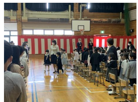
担任の先生と一緒に退場。