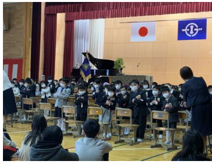
1年生全員で、歌「大きな栗の木のうた」